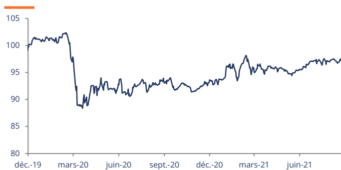
Performance affichée depuis création le 02/10/2019