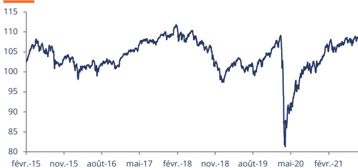
Performance affichée depuis le 31/12/2014