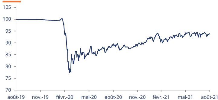
Performance affichée depuis création le 29/08/2019